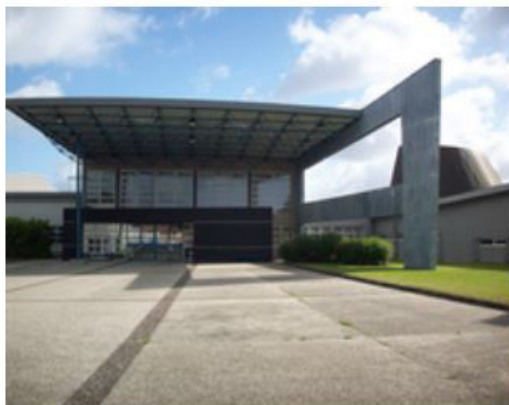
Ce que l'on voit en arrivant au lycée