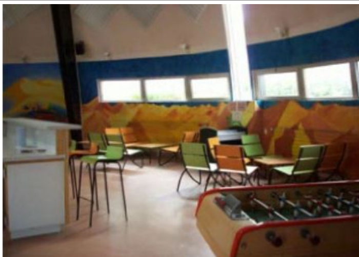
La cafétéria des élèves.